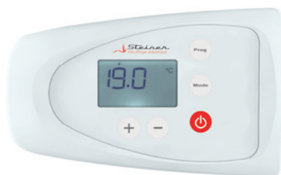
Thermostat digital à fil pilote 6 ordres

La légèreté du radiateur simplifie le montage.